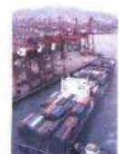
Υπολογίζεται ότι ένα container του μεταφορέα του σπιντάρ, π.χ. 1.800 ευρώ, θα εκτιναχθεί...

Η έλλειψη ρευστότητας, εκτιμούν παράγοντες της αγοράς των Logistics, θα φέρει την τρεχούσα εβδομάδα μια από τις ισχυρότερες ημεσές >10